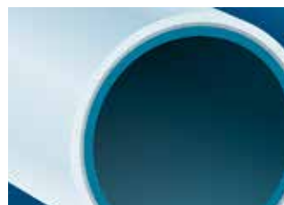
Uni Pipe PLUS