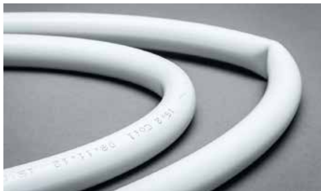
Porovnání starého a nového potrubí