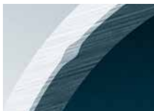
Tupě svařovaný hliník