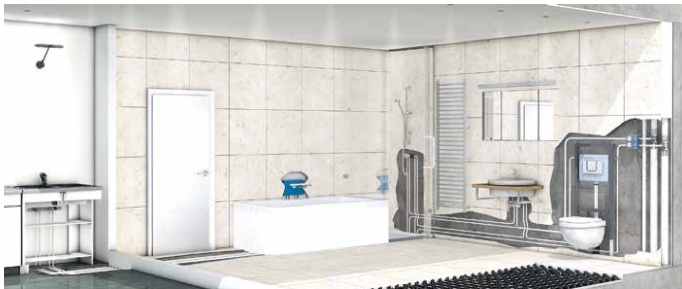
Okružová instalace (malý rádius) pro kuchyňské a koupelnové sestavy

Můžete si vybrat tu správnou variantu Uni Pipe PLUS kompozitního potrubí pro vaše přesné potřeby na pracovišti - jako tyčové nebo kotoučové provedení, předizolované nebo v ochranném potrubí. V případě, že máte zájem dozvědět se více o všech výhodách a možnostech, rádi vám poskytneme osobní pomoc.