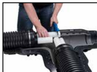
Hranu potrubí svíslé seřízněte.