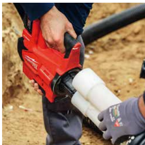
Expandér Milwaukee M18 VLD PEX