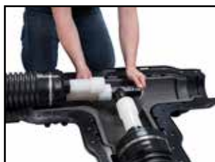
Rychle nasuňte tvarovku, dokud se nezastaví o instalační výstupek. Přidržte, dokud se potrubí nesmrští.