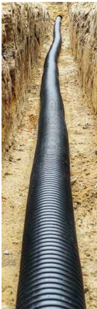
Ecoflex Thermo PRO