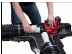
Potrubí rozexpandujte. Pro zajištění jednotného rozšíření se expandér otáčí podle integrované funkce automatického otáčení.